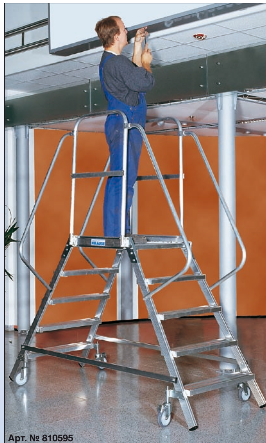
Арт. № 810595